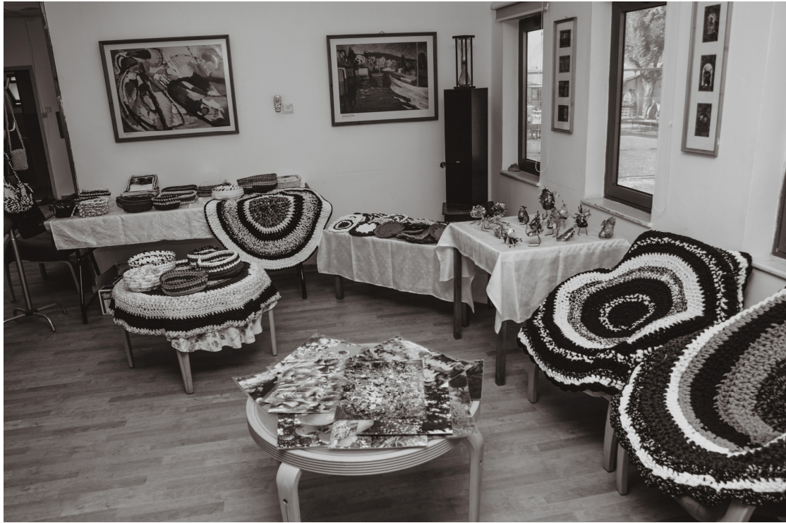
מעבודותיה של נירה שויאר