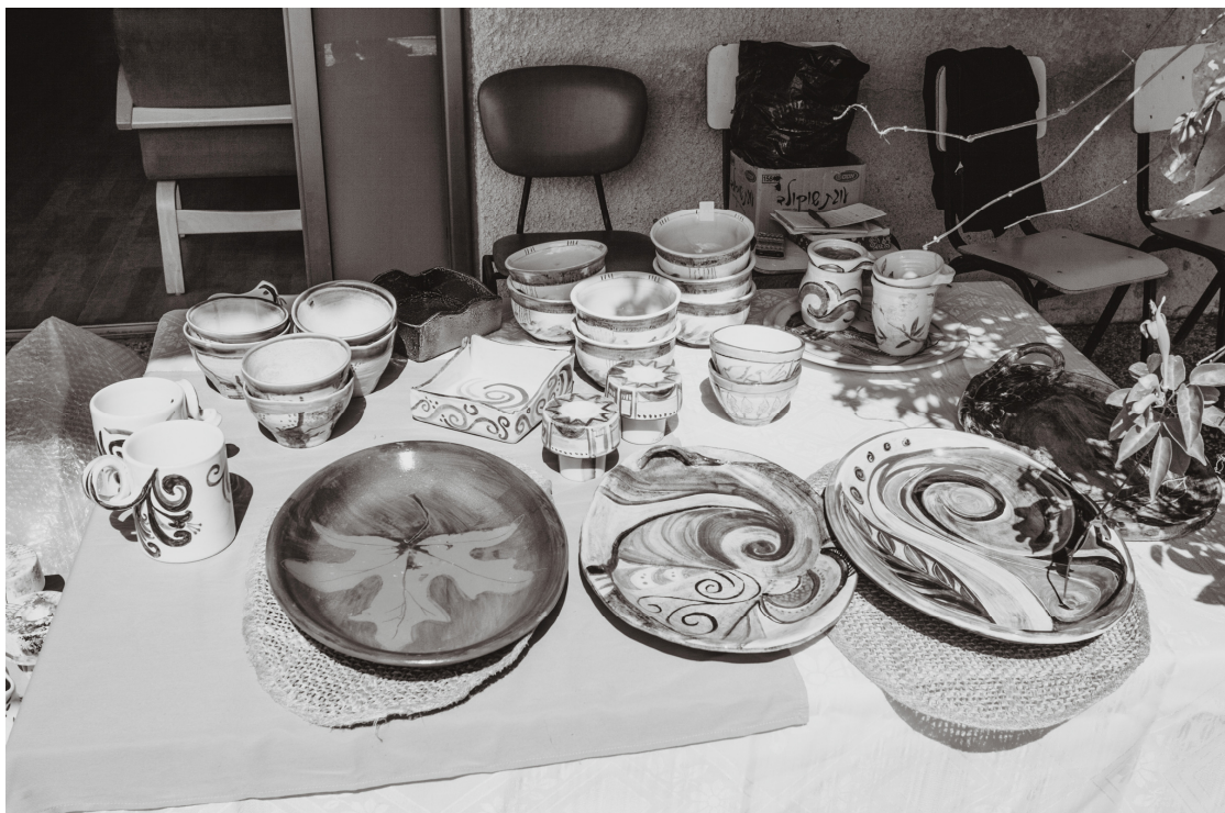
מעבודותיה של תלמה

את התמונות של אסתר לפידות ותמוז שני לא פרסמנו בגלל שלא יצאו מוצלחות בדפוס.